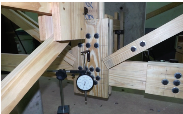
Figura 3 Relógio para leitura do deslocamento vertical instalado na estrutura

Ainda, foram instalados relógios comparadores, como demonstrado na Figura 3, com resolução de 0,001 mm, responsáveis pela leitura das deformações das ligações de extremidade e da ligação da emenda do banzo inferior. No centro das treliças instalaram-se relógios adicionais, com resolução de 0,01 mm, responsáveis por medir o deslocamento vertical da treliça neste ponto.